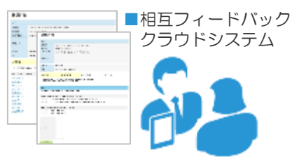
■相互フィードバッククラウドシステム